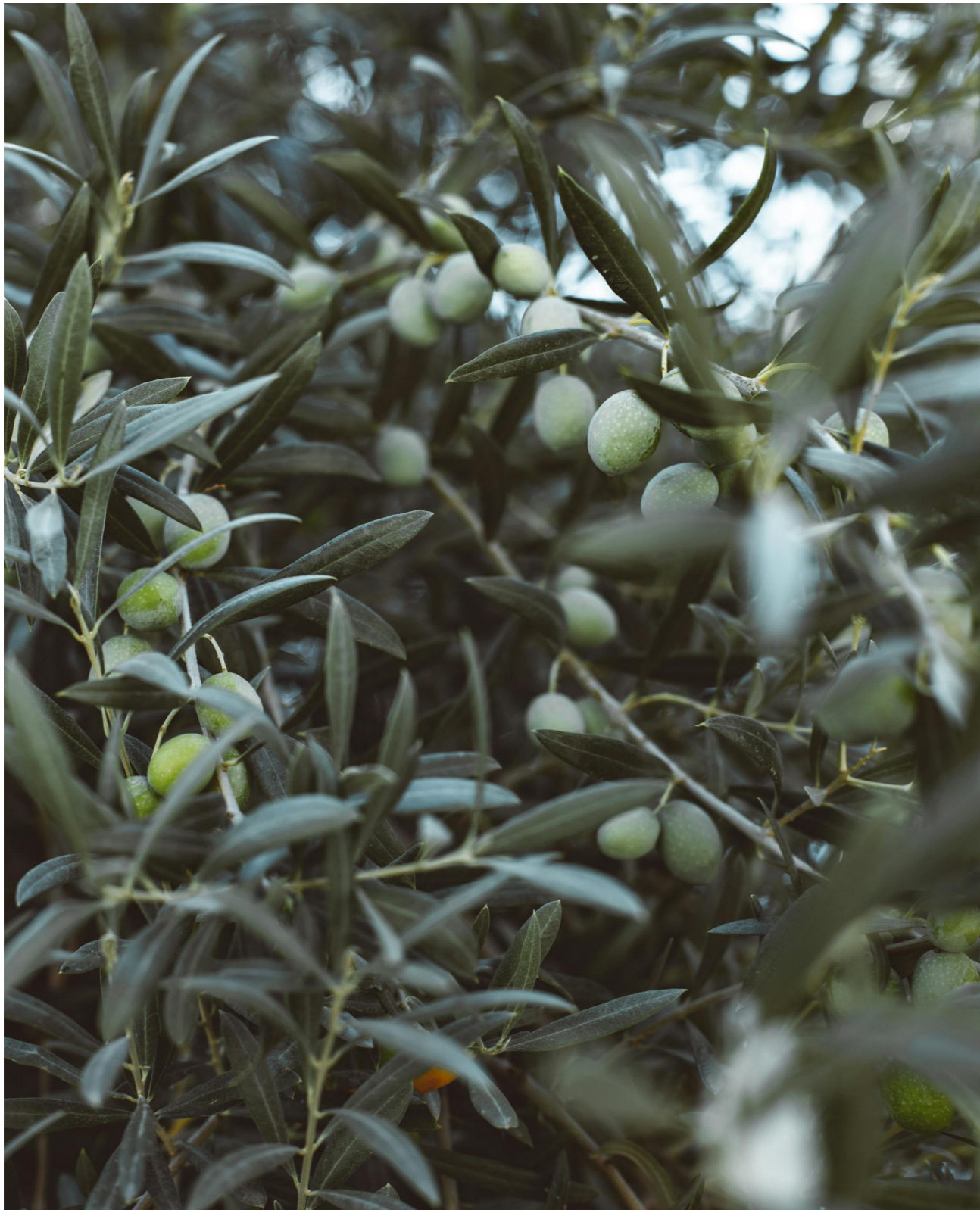
El olivar tradicional jiennense fue objeto de dos de las tres jornadas, abordando su futuro en la diversificación y reconversión.

El Consejo Económico y Social de la provincia de Jaén celebró en febrero y marzo tres jornadas especializadas en su sede. Eventos de gran relevancia destinados a abordar aspectos fundamentales vinculados al sector del olivar y la construcción, dos pilares esenciales en la economía jiennense. Estas jornadas congregaron a una amplia gama de expertos en agricultura, economía y formación profesional, quienes ofrecieron ponencias exhaustivas y participaron en mesas redondas para analizar en profundidad los retos y oportunidades que enfrentan estos sectores en la actualidad.